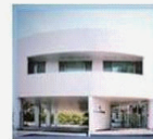
永野病院 Nagano Hospital ベット数 60床

「永野病院」と「介護老人保健施設梅香苑」併設。 市原市養老に「加茂診療所」開設。