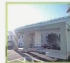
加茂診療所 Kamo Clinic 永野病院 分院