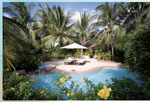
シーフロントジャグジーヴィラ