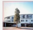
介護老人保健施設 梅香苑 Ume Kaikan ベット数 98床